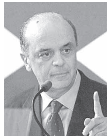
José Serra, alcalde de Sao Paulo.

Lula perdería la primera ronda de una votación frente al candidato del Partido de la Social Democracia Brasileña, José Serra, actual